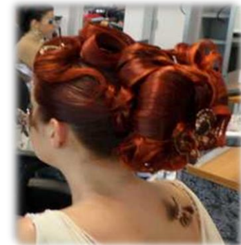
Modèles de coiffure BM